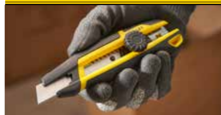
Wird mit einer STANLEY® 1095 Klinge geliefert und ist kompatibel mit anderen STANLEY® 18 mm Abbrechklingen.