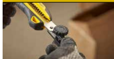
Das magnetische Klingeneinsetzen gewährleistet zusätzliche Sicherheit und einfache Bedienung.