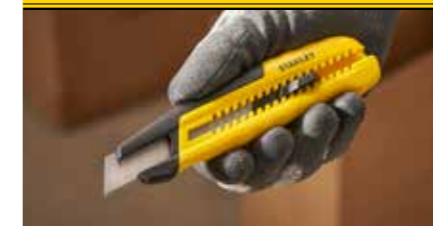
Wird mit einer STANLEY® 1095 Klinge geliefert und ist kompatibel mit anderen STANLEY® 18 mm Abbrechklingen.