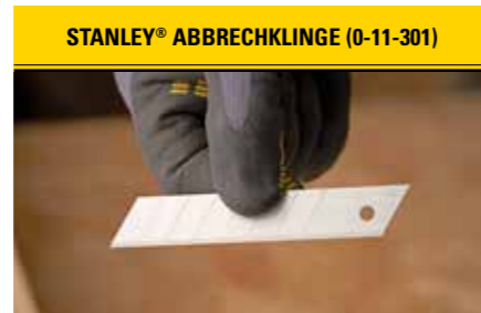
STANLEY® ABBRECHKLINGE (0-11-301) Die originale Abbrechklinge von STANLEY® – entwickelt und hergestellt in Sheffield, England.