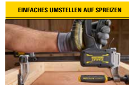
EINFACHES UMSTELLEN AUF SPREIZEN Schnellwechselmechanismus ohne zusätzliches Werkzeug zum Umstellen von Spannen auf Spreizen.