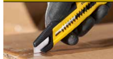
Das optimierte Design sorgt für ein außergewöhnliches Schneideergebnis, auch bei wiederholten Anwendungen.