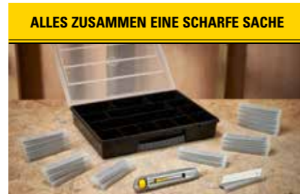
ALLES ZUSAMMEN EINE SCHARFE SACHE Im Set enthalten: 1 InterLock™ Cutter 18 mm, 200 Klingen, 1 Organizer