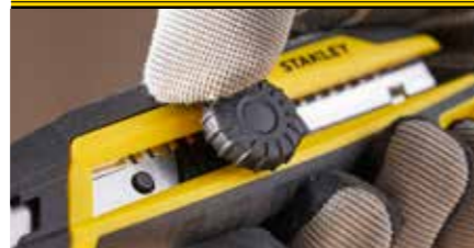
Das Gewinderad ermöglicht eine schnelle und intuitive Einstellung der Klingentiefe.