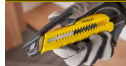
Einhandiger Abbrechmechanismus für einfachen und sicheren Klingeabbruch ohne zusätzliche Werkzeuge.