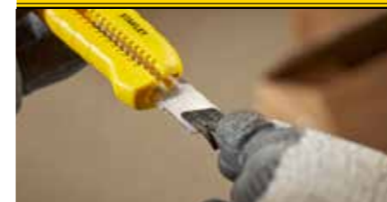
Das einfache Klingeneinsetzen gewährleistet zusätzliche Sicherheit und schnelle Bedienung.