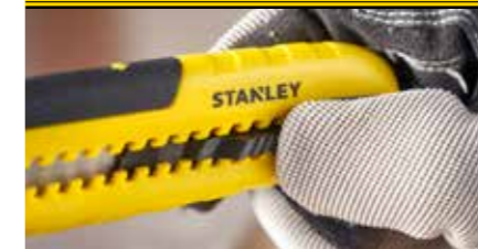
Die Schieberverriegelung ermöglicht eine schnelle und intuitive Einstellung der Klingentiefe.