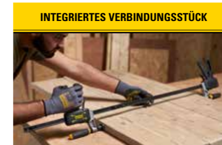
INTEGRIERTES VERBINDUNGSSTÜCK Integriertes Verbindungsstück kombiniert zwei Zwingen für zusätzliche Erhöhung der Länge.