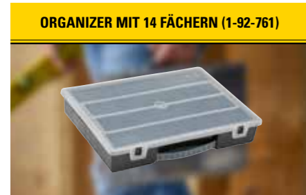
ORGANIZER MIT 14 FÄCHERN (1-92-761) Der praktische Organizer mit seinen 14 Fächern bietet Platz für allerlei Zubehör, wie Klingen, Messer, Kleinteile.