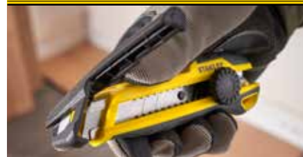
Einhandiger Abbrechmechanismus für einfaches und sicheres Abbrechen der Klinge ohne zusätzliche Werkzeuge.