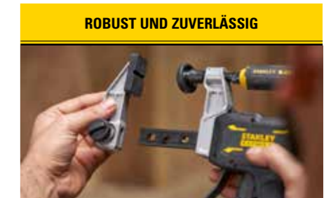
ROBUST UND ZUVERLÄSSIG Metallbacken und I-Profil-Schiene aus Stahl verhindern Verbiegen und Brechen. Für längere Haltbarkeit.