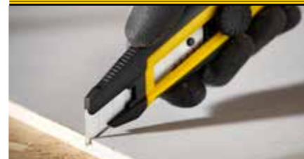
Langlebige Konstruktion, hergestellt aus einem strapazierfähigen Edelstahl-Klingenbehälter.