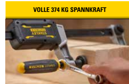
VOLLE 374 KG SPANNKRAFT Wird erreicht durch den eingebauten Schraubgriff (mit Sechskantprofil) für extrem sicheren Halt.