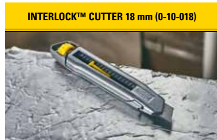
INTERLOCK™ CUTTER 18 mm (0-10-018) Druckgeogener Metall-Korpus. Patentierte InterLock™ Verbindung. Einfacher Klingenwechsel.